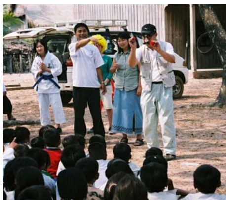
子供たちに手品を披露する住職

日本では見えなかったものが見えてきました。それは平和な社会を実現することです。そしてそれに結びつく夢を持ちたいと思いました。」「カンボジアで光と影を見ました。本で読んだ戦争の悲惨さ。戦争から立ち直ろうとする活気ある現実。戦争で何度も死にそうになりながら生き延び、一人一人の命を大切にする戦争のない社会を作り出してゆく子供たちを育てるために教育に携わるカンボジアの人々。苦しい体験を話す時の苦難に満ちた表情と、平和な社会を創造しようと語る輝いた表情との、光