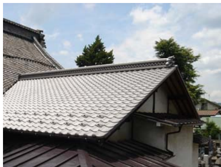
昨年葺き替えられた開山堂の屋根

また本年の全久院の事業は、消防署より指摘のあった火災報知器と消火設備の設置を完了する、本堂の屋根ふき替えの準備に入る、などを予定しています。資金に関しては、寄付をお願いせずに、宗教法人と護持会の両方から支出してゆきたいと考えています。