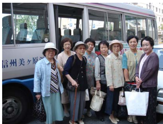
温泉へとバスに乗り込む観音講の皆さん

温泉にて行い、一年が始まりました。2月から5月まで毎月一度と全久院にて通常の観音講を開催しました。観音様の前でお経を唱え、家族の「幸福を祈り、ご詠歌をお唱えし、寺の自家製の精進料理でお昼を召し上がっていただきました。今年から、大黒のピアノに合わせて、唱歌を歌い始めました。今歌っているのは、「野ばら」と「花」です。講員の皆さんは歌が大好きで、2部合唱にもチャレンジしています。大きな声と一緒に歌うのはなかなか気持ちの良いものです。また息を長く続けるので長生き(長息?)になります!