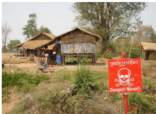
民家のそばにも地雷が埋設されていた

と影。今回いろいろなことを経験して、何事も自ら体験しなければ現実には分からない、ということに初めて気付きました。今まで私は自分が生きてゆく道を見つけようとしてきました。でも自分に対して自信がなく、どう生きたらいいか迷っていました。しかし、カンボジアの人は、4~5人も乗ってしまうバイクのタクシー、ひっくり返りそうになるまでバイクに荷を積んで走り去る人、一日かけて数匹しか取れなくても平然としている漁師、電気が引かれてなくてもカーバッテリーでテレビを見人々…。人間つて意外に逞しい。私だって数日ではあるが彼らと同じものを食べ、同じ時を過ごしたが、けっこう生きていけるじゃないか。日本では小、中、高、大学ときっちりレールが敷かれている。しかしカンボジアには生きる道はたくさんある。これから私も勇気を持って自分の生き方を見つけることが出来そうな予感がする。」