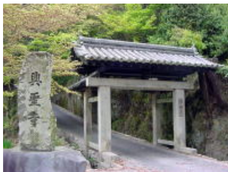
現在の興聖寺の山門

観音導利興聖宝林寺開創 道元禅師の帰朝後の活躍は興聖寺開創から始まったといえます。1233年天福元年極楽寺を観音導利興聖宝林禅寺と改称、興聖は聖道の興隆と国家の安寧を、宝林は中国禅宗の曹溪の宝林寺に達するの意味で名づけられた。法堂は正覚尼により寄進されたといわれている。正覚尼は道元の父通親の妹で、源実朝の妻だった。実朝は頼朝の子で頼家の弟。頼家は二代将軍になったが、23才で刺殺された。殺される1年前に建仁寺建立したり、三男を栄西